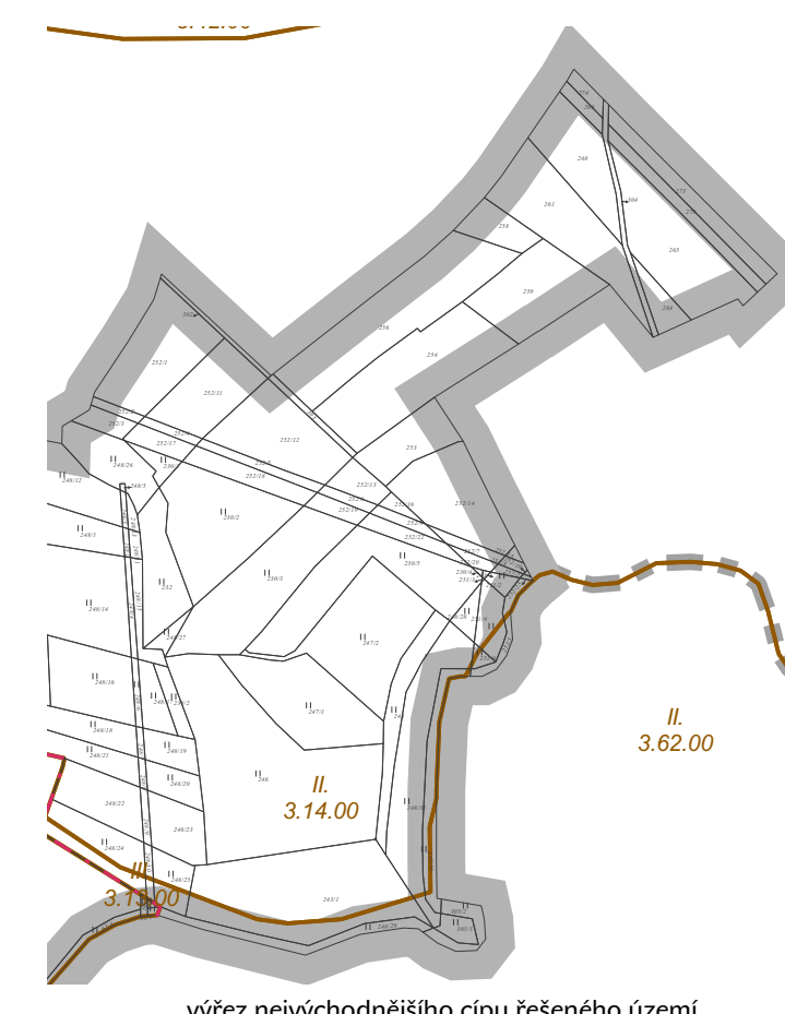
výkres nevysohodňujícího čípu řešeného území