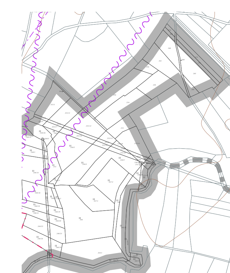
výřez nevyhodnotěného cípu řešeného území